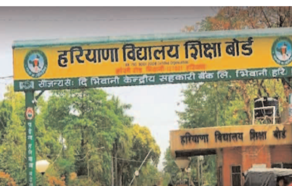
फिजिकल हेल्थ की होगी।

शनिवार को हरियाणा बोर्ड के 10वीं के स्टूडेंट्स ने हिंदी की परीक्षा दी। परीक्षा 83 केंद्रों पर शांतिपूर्ण रूप से सम्पन्न हुई। जिले में 10 हजार से अधिक स्टूडेंट्स ने हिंदी की परीक्षा दी। परीक्षा सेंटर से निकलते स्टूडेंट्स काफी खुश नजर आए। इस दौरान स्टूडेंट्स ने बताया कि पेपर आसान रहा। पेपर पांच सेक्शन में विभाजित था। पहले सेक्शन में बहुविकल्पीय प्रश्न थे। जबकि अन्य सेक्शन में अति लघु और वर्णनात्मक प्रश्नों के उत्तर देने थे। परीक्षा के लिए कुल 3 घंटे का समय मिला। परीक्षा केंद्रों पर चेकिंग के बाद स्टूडेंट्स को प्रवेश दिया गया। हालांकि, हिंदी की पूरी परीक्षा आसान रही है। अब दसवीं कक्षा की अगली परीक्षा 5 मार्च को