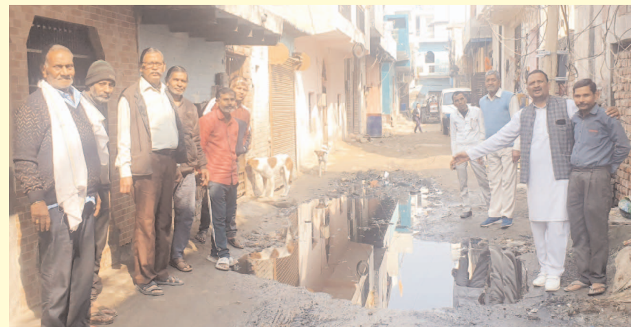
Nidhi Kushwaha/Alive News

नाला रोड़ के पास ही पार्क बनाने को लेकर प्रशासन ने शुरुआत कर दी है, यहां तक की उसकी दीवारें भी बनवा दी है। लेकिन उसका अधूरा निर्माण पड़ा है, वह डेवलप ही नहीं हुआ है। डेवलप न होने के कारण वह मैदान खाली पड़ा है। इस वजह से वहां रहने वाले आसपास के लोग व मार्केट के लोगों ने उस मैदान में अपनी पार्किंग शुरू की हुई है जो की बिना किसी परमिशन के सरकारी जमीन पर अवैध पार्किंग करते हैं। उसी के पास में ही एक कम्प्यूनिटी