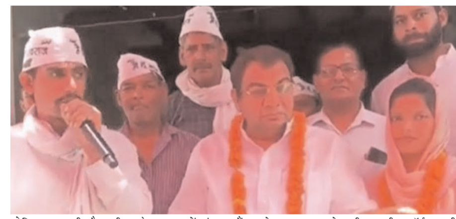
कोशिश कर रही है। परीक्षा के आवेदन के लिए सिर्फ तीन दिन बचे हैं, जबकि अभी तक दसवीं और बारहवीं की परीक्षा के फॉर्म भी नहीं भरे गए हैं। हरियाणा प्रदेश के अस्थायी मान्यता प्राप्त निजी स्कूल शिक्षा विभाग के बॉन्ड राशि के चक्र में फंस गए हैं। इससे लगभग 60 हजार बच्चों के अभिभावक व बच्चे असमंजस की स्थिति में हैं। उन्होंने कहा कि हरियाणा शिक्षा बोर्ड ने सभी कक्षाओं की वार्षिक परीक्षाओं को शेड्यूल जारी कर दिया है वहीं दूसरी ओर इन स्कूलों के

उन्होंने कहा कि एक तरफ सरकारी स्कूल मर्ज के नाम पर बंद किये जा रहे हैं। दूसरी तरफ सरकार प्राइवेट स्कूल के बच्चों को भी बोर्ड की परीक्षाएं देने से वंचित रखने की