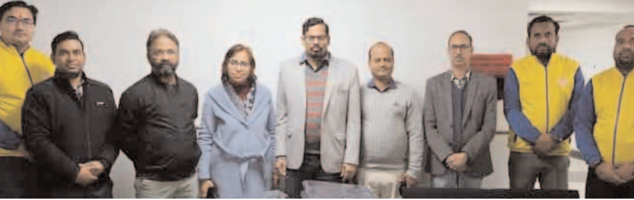
चैरिटी करते रहे हैं और आगे भी समयानुसार यह प्रकल्प चलेंगे। इस

जाता है। इसके तहत हम गुरु महाराज के निर्देश पर अनेक जगहों पर दान, सेवा, सत्संग आदि के आयोजन करते हैं। जिसमें स्थानीय लोगों एवं प्रशासन से भी भरपूर प्रशंसा प्राप्त होती है। उन्होंने बताया कि आज एक बार फिर हमने गुरु महाराज से कंबल प्रसाद रूप में प्राप्त किए और यहां ईएसआई प्रबंधन को दिए हैं। जिनका प्रयोग यह अपनी जरूरत के हिसाब से जरूरतमंदों के बीच करेंगे। हम इससे पहले भी इस अस्पताल में