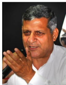
Gujjar's health over phone on Sunday.

The 63-year-old MLA from Jagadhri was attending an event in the district on Sunday when he complained of dizziness