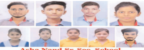
Asha Nand Sr. Sec. School