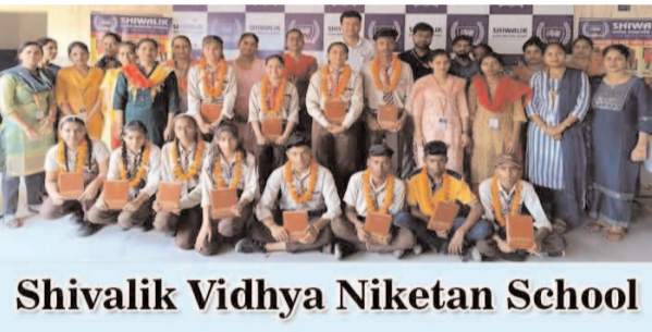
Shivalik Vidhya Niketan School